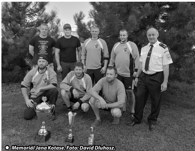
● Memorál Jana Kotase.