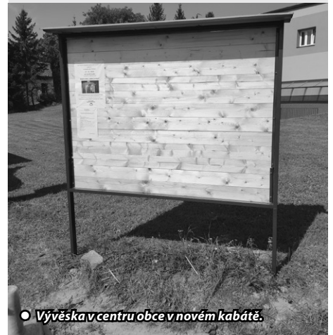
• Vývěska v centru obce v novém kabátě.