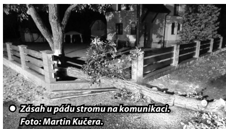
● Zásah u pádu stromu na komunikaci.

Na konci prázdnin v neděli 27. 08. jsme v nočních hodinách zasahovali v Orlové Lutyni na ul. Mírové, kde došlo k pádu stromu na místní komunikaci. Na místě zasahovali Kučera, Šebesta R.+L. a Dluhosz. V úterý 29. 08. v dopoledních hodinách jsme byli povoláni