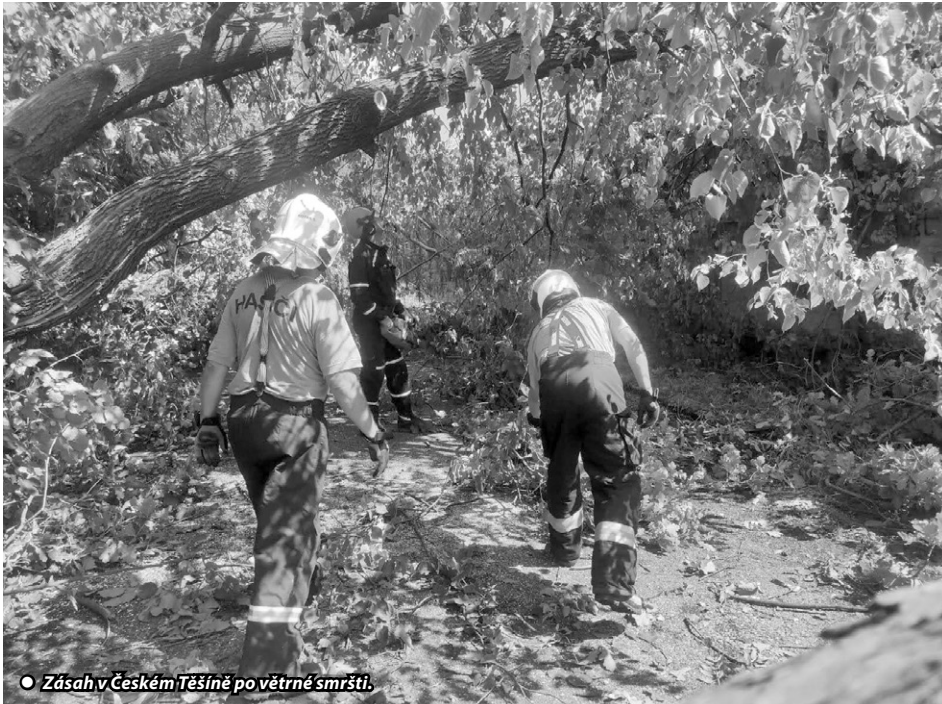
● Zásah v Českém Těšíně po větrné smršti.