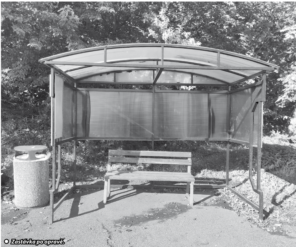
○ Zastávka po opravě.

Michal Pavlica, správa bytového a nebytového fondu, místní hospodářství