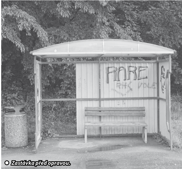
○ Zastávka před opravou.

Obec Doubrava nedávno dokončila rekonstrukci sedmi přístřešků autobusových zastávek, které byly vybaveny novým polykarbonátovým krytím. Tato modernizace měla za cíl zvýšit komfort a bezpečnost cestujících, zejména v nepříznivém počasí.