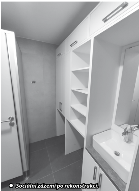
● Sociální zázemí po rekonstrukci.