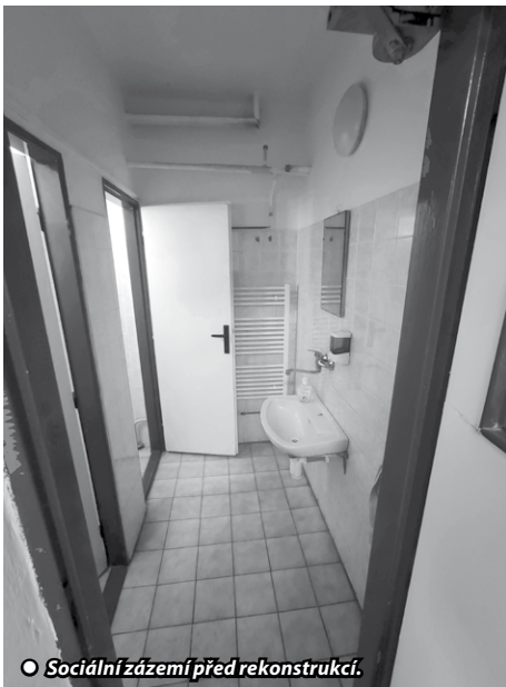
● Sociální zázemí před rekonstrukcí.